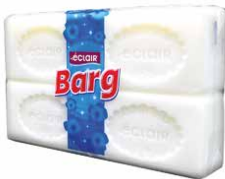
Barg (Universal xo'jalik sovuni) (Универсальное хозяйственное мыло) (2x2)

Quti o'lchami / Размер коробки: 357x200x153 mm/мм 48 dona / шт. 180 g / r e