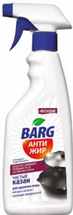
Barg Средство Анти жир. Quti o'lchami / Размер коробки: 265x200x220 mm/мм 12 dona / шт. 500 ml / мл e