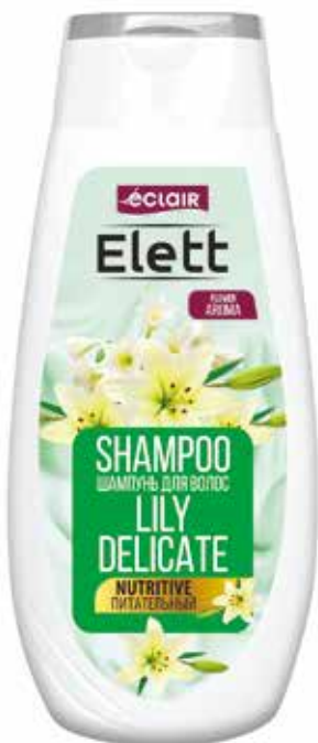
Elett Шампунь Питательный. Quti o'Ichami / Размер коробки: 265x260x215 mm/мм 18 dona / шт. 380 ml / мл e

Шампунь для волос "Elett". Для того чтобы восстановить структуру волос, вернуть им жизненную энергию и красоту, воспользуйтесь замечательным шампунем для сухих и поврежденных волос "Elett". В состав шампуня входит ванильное и эфирное масло жасмина, которые буквально преобразуют волосы, делая их шелковистыми и увлажненными.