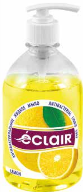
Éclair Жидкое мыло Лимон. Quti o'lchami / Размер коробки: 394x230x180 mm/мм 15 dona / шт. 500 ml / мл e