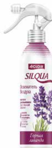
Silqua Освежитель Воздуха Горная лаванда. Quti o'lchami / Размер коробки: 290x175x264 mm/мм 15 dona / шт. 400 ml / мл €

Освежитель воздуха “Silqua” на водной основе разработан для устранения неприятного запаха в Вашем доме, кухне, туалетном помещении, офисе и автомобиле. Освежитель надолго наполнит Ваш дом неповторимым и приятным тонким ароматом яблоневого сада.