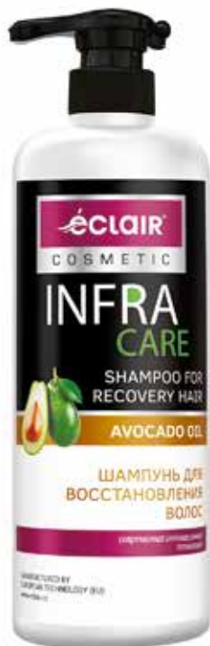
Infra Care Шампунь Для восстановления волос. Quti o'lchami / Размер коробки: 330x165x255 mm/мм 8 dona / шт. 900 ml / мл e