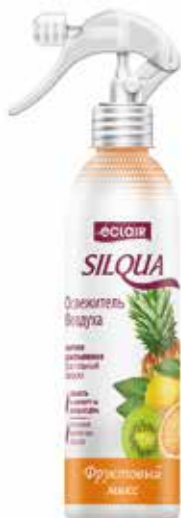
Silqua Освежитель Воздуха Фруктовый микс. Quti o'lchami / Размер коробки: 290x175x264 mm/мм 15 dona / шт. 400 ml / мл €