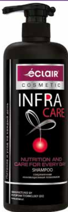
Infra Care Шампунь Питание и уход на каждый день. Quti o'lchami / Размер коробки: 330x165x255 mm/мм 8 dona / шт. 900 ml / мл e

Шампунь для волос "INFRA CARE", благодаря лецитину и Д-Пантенолу является прекрасным средством для интенсивного питания и ухода за волосами на каждый день.