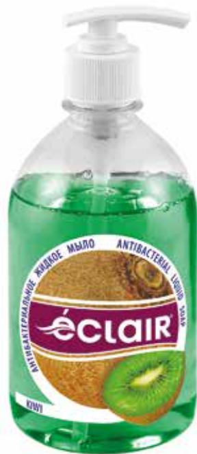
Éclair Жидкое мыло Киви. Quti o'lchami / Размер коробки: 394x230x180 mm/мм 15 dona / шт. 500 ml / мл e

Жидкое мыло с экстрактом яблока содержит яблочные кислоты и аминокислоты, а также комплекс витаминов, которые защищают и успокаивают кожу. Масло зародышей пшеницы увлажняет и смягчает кожу. Подходит для принятия ванн и душа.