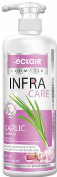
Infra Care Шампунь Сила роскошных волос. Quti o'lchami / Размер коробки: 330x165x255 mm/мм 8 dona / шт. 900 ml / мл e

Шампунь “INFRA CARE” с экстрактом чеснока, керопептидами и комплексом растительных протеинов способствует регенерации и укреплению волосяной луковицы, прекрасно подходит для ежедневного применения, обладает замечательными моющими качествами, не сушит кожу головы и не утяжеляет волосы. Без запаха чеснока.