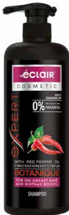
Expert Шампунь Для жирных волос. Quti o'lchami / Размер коробки: 330x165x255 mm/мм 8 dona / шт. 900 ml / мл e