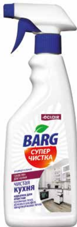
Barg Средство Супер чистка. Quti o'lchami / Размер коробки: 265x200x220 мм/мм 12 dona / шт. 500 ml / мл e