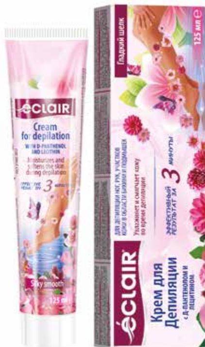
Éclair Крем-депилятор Гладкий шелк. Quti o'lchami / Размер коробки: 315x187x212 mm/мм 20 dona / шт. 125 ml / мл

Крем-депилятор “Éclair” Гладкий шелк создан для быстрого и качественного удаления ненужных волос на ногах, руках, в области бикини и подмышках. В состав данного крема входят D-Пантенол и лецитин, которые оказывают разглаживающее, увлажняющее и смягчающее действие на кожу при проведении процедуры депиляции. Поэтому через несколько минут после нанесения крема кожа становится нежной и гладкой как шелк.