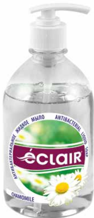
Éclair Жидкое мыло Ромашка. Quti o'lchami / Размер коробки: 394x230x180 мм/мм 15 dona / шт. 500 ml / мл e