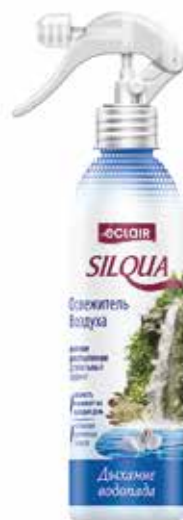
Silqua Освежитель Воздуха Дыхание водопада. Quti o'lchami / Размер коробки: 290x175x264 mm/мм 15 dona / шт. 400 ml / мл €

Освежитель воздуха “Silqua” на водной основе разработан для устранения неприятного запаха в Вашем доме, кухне, туалетном помещении, офисе и автомобиле. Освежитель надолго наполнит Ваш дом неповторимым и приятным тонким ароматом йогурт с ежевикой.