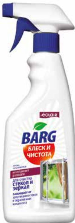
Barg Средство Блеск и чистота. Quti o'lchami / Размер коробки: 265x200x220 мм/мм 12 dona / шт. 500 ml / мл e

Чистящее средство предназначено для очистки стекол и зеркал. Средство бережно и надежно очищает стеклянные, зеркальные и пластиковые поверхности, предотвращает запотевание стекол и образование конденсата. Эффективен при удалении всех видов загрязнений (грязь, жир, отпечатки пальцев). Легко смывается, не оставляет разводов, защищает от запотевания и придает блеск.