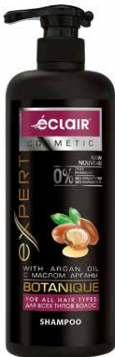
Expert Шампунь Для всех типов волос. Quti o'lchami / Размер коробки: 330x165x255 mm/мм 8 dona / шт. 900 ml / мл e