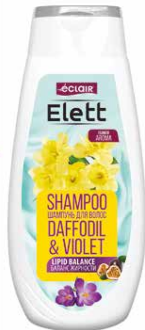
Elett Шампунь Баланс жирности. Quti o'Ichami / Размер коробки: 265x260x215 mm/мм 18 dona / шт. 380 ml / мл e