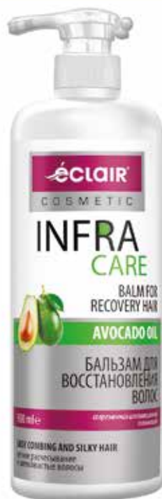
Infra Care Бальзам Для восстановления волос. Quti o'lchami / Размер коробки: 330x165x255 mm/мм 8 dona / шт. 900 ml / мл e

Шампунь для волос “INFRA CARE” обогащённый маслом авокадо, способствует восстановлению повреждённой структуры изнутри и устраняет пересушивание волос. Придаёт шелковистость и лёгкость укладки.