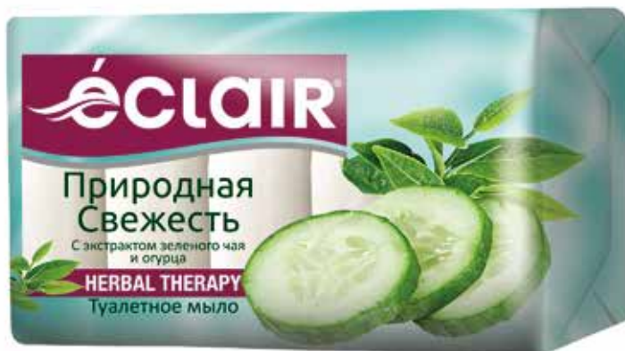
Natural freshness / Природная свежесть (1x5)

Éclair туалетное мыло. Quti o'lchami / Размер коробки: 392x177x135 mm/мм 100 dona / шт. 70 g / r e