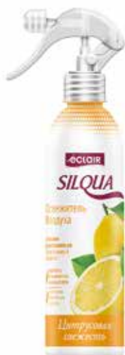
Silqua Освежитель Воздуха Цитрусовая свежесть. Quti o'lchami / Размер коробки: 290x175x264 mm/мм 15 dona / шт. 400 ml / мл €

Освежитель воздуха “Silqua” на водной основе разработан для устранения неприятного запаха в Вашем доме, кухне, туалетном помещении, офисе и автомобиле. Освежитель надолго наполнит Ваш дом неповторимым и приятным тонким ароматом белой розы.