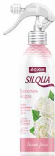
Silqua Освежитель Воздуха Белая роза. Quti o'lchami / Размер коробки: 290x175x264 mm/мм 15 dona / шт. 400 ml / мл €