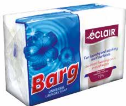
Barg (Universal xo'jalik sovuni) (Универсальное хозяйственное мыло) (1x4)

Quti o'lchami / Размер коробки: 334x192x155 mm/мм 48 dona / шт. 175 g / r e