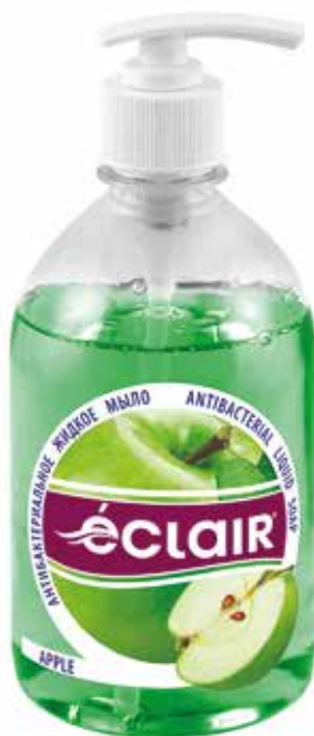
Éclair Жидкое мыло Яблока. Quti o'lchami / Размер коробки: 394x230x180 mm/мм 15 dona / шт. 500 ml / мл e