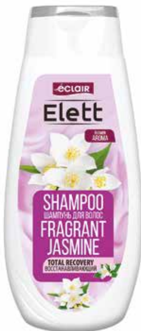
Elett Шампунь Восстанавливающий. Quti o'Ichami / Размер коробки: 265x260x215 mm/мм 18 dona / шт. 380 ml / мл e

Шампунь для волос "Elett", Питательный шампунь "Elett" с экстрактом лилии - это бережное средство для ухода за волосами любого типа, особенно для слабых, безжизненных, поврежденных и пересушенных волос. Вернет вашим волосам силу и природный блеск, облегчит расчесывание, тонизирует и увлажнит кожу головы.