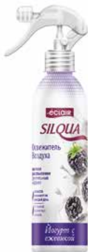
Silqua Освежитель Воздуха Йогурт с ежевикой. Quti o'lchami / Размер коробки: 290x175x264 mm/мм 15 dona / шт. 400 ml / мл €

Освежитель воздуха “Silqua” на водной основе разработан для устранения неприятного запаха в Вашем доме, кухне, туалетном помещении, офисе и автомобиле. Освежитель надолго наполнит Ваш дом неповторимым и приятным тонким ароматом тысяча и одна ночь.