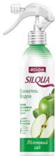
Silqua Освежитель Воздуха Яблоневый сад. Quti o'lchami / Размер коробки: 290x175x264 mm/мм 15 dona / шт. 400 ml / мл €

Освежитель воздуха “Silqua” на водной основе разработан для устранения неприятного запаха в Вашем доме, кухне, туалетном помещении, офисе и автомобиле. Освежитель надолго наполнит Ваш дом неповторимым и приятным тонким ароматом цитрусовой свежести.