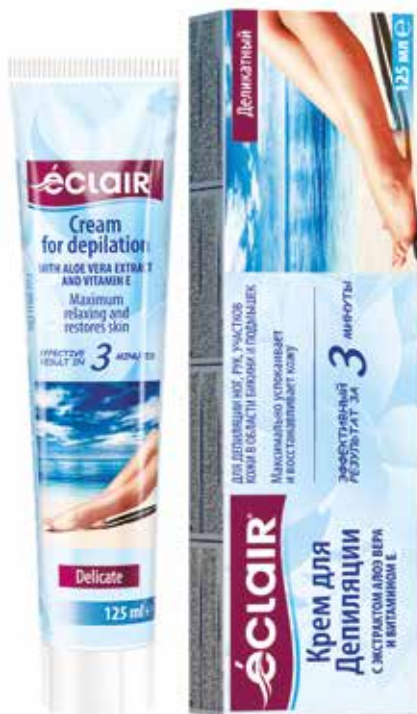
Éclair Крем-депилятор Деликатный. Quti o'lchami / Размер коробки: 315x187x212 mm/мм 20 dona / шт. 125 ml / мл