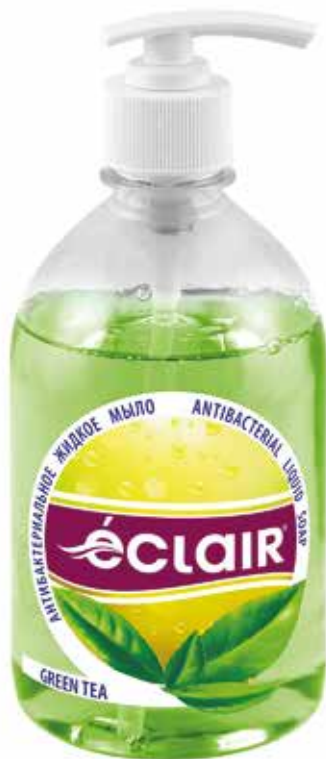
Éclair Жидкое мыло Зеленый чай. Quti o'lchami / Размер коробки: 394x230x180 мм/мм 15 dona / шт. 500 ml / мл e

Жидкое мыло с экстрактом зеленого чая смягчает и увлажняет кожу. Антиоксиданты, входящие в состав экстракта зеленого чая, защищают кожу от вредного воздействия окружающей среды, тем самым укрепляют барьерные и иммунные функции кожи. Подходит для принятия ванн и душа.