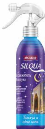
Silqua Освежитель Воздуха Тысяча и одна ночь. Quti o'lchami / Размер коробки: 290x175x264 mm/мм 15 dona / шт. 400 ml / мл €

Освежитель воздуха “Silqua” на водной основе разработан для устранения неприятного запаха в Вашем доме, кухне, туалетном помещении, офисе и автомобиле. Освежитель надолго наполнит Ваш дом неповторимым и приятным тонким ароматом фруктовый микс.