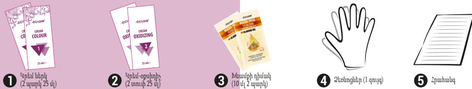
1 Կրեմ ներկ (2 պարկ 25 մլ) 2 Կրեմ-օքսիդիչ (2 տուփ 25 մլ) 3 Խոտանքի դիմակ (10 մլ 2 պարկ) 4 Ձեռնոցներ (1 գույց) 5 Հրահանգ

ԳՈՒՆԱՆԵՐԿՎԱԾ ՄԱՉԵՐԻ ԽՈՒՄԻՆԻ ԴԻՄԱԿԸ ՈՐԸ ՆԵՐԱՌՈՎԱԾ Է ՏՈՒՓԻ ՄԵՋ, ՊԱՆՊԱՆՈՒՄ Է ՄԱՉԵՐԻ ԳՈՒՆՆԵՐ ԲԱՅԸ ԵՎ ԽՈՒՄԻՆԻ ԵՐԿՐԱՐ ԺԱՄԱՆԱԿ: ⚠ ՄԻ ՊԱՆՊԱՆՈՒՄ ԵՎ ՕԳՏԱԳՈՐԾՎԱԾ ԽՈՒՄԻՆԻՆԸ www.eclair.uz